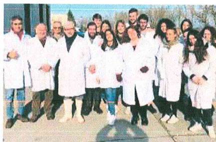
DA BORGOGGIO Ogni anno, studenti dell'Università di Milano visitano la storica azienda. A fianco, immagini dal sito web